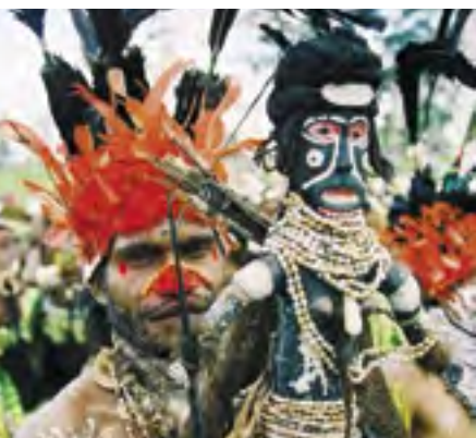
Etnické líčení Papuánce a sošky na slavnostech v Mount Hagen