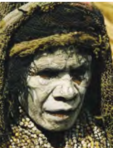
Papuánské ženy kmene Dani si při úmrtí člena rodiny na znamení smutku potírají obličej bílým pigmentem