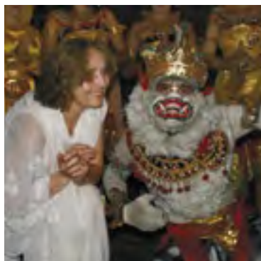
Cesta za maskami, Bali, 2010