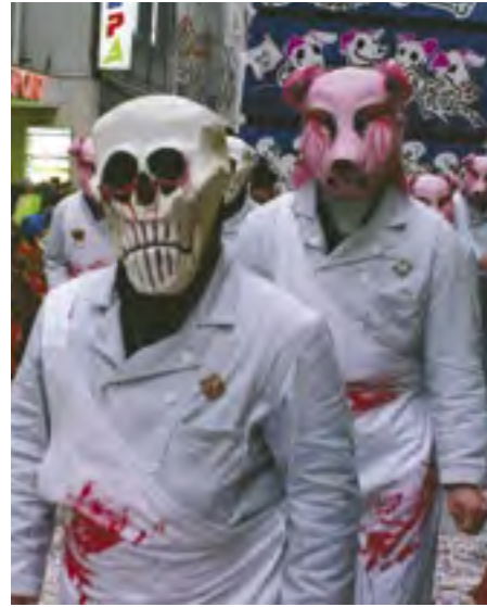
Skupinu masek prasat doprovázejí masky smrtek představující řezníky. Bazilejský masopust, 2006

U mnoha kultur se vedle masek a tělové malby setkáváme také s dalšími proměnami vzhledu – tetováním, brandingem, skarifikací, vkládáním předmětů pod kůži, do perforovaných uší, nosu, rtů a dalších částí těla. Tyto fyzické modifikace těla však nemůžeme považovat za masky především proto, že se jedná o změny trvalého charakteru, které nebyly určeny ke skrytí tváře nebo těla. Hypoteticky bychom mohli za masku označit takovou bodyartovou změnu vzhledu, při které zároveň došlo k výrazné „rolové“ proměně vnitřní identity. Jako příklad uvádíme Toma Lepparda ( foto str. 43 ), který se tetovaným vzorem přiblížil gepardovi a vytvořil tak na svém těle specifickou formu „trvalé masky“ a zároveň tím změnil dosavadní způsob svého života.