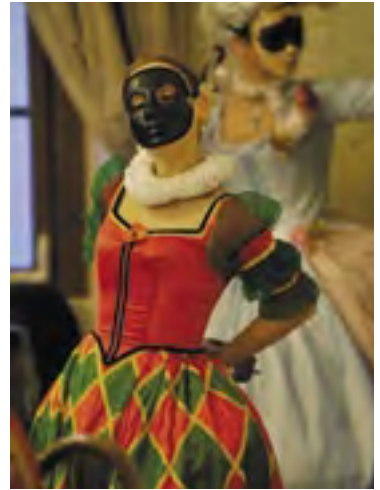
Carnevale Praha – maska Harlekyňky. Tradici slavných karnevalů obnovil R. M. Müller a další organizátoři v roce 2006

S pojmem maskování se setkáváme také v psychologických kontextech, kde plní funkce specifických sociálních rolí.