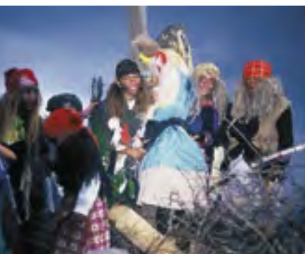
O filipojakubské noci se pálí čarodějnice v mnoha lokalitách České republiky