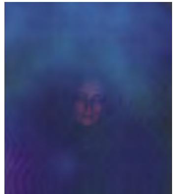
Aura je odrazem mentálního, duchovního a emočního stavu. Jako projev koherentního záření ji lze zachytit na speciálním fotografickém přístroji v spektrálním pásmu 390 – 790 nanometrů