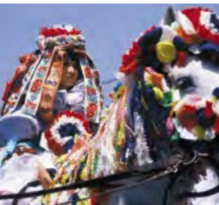
Maskování krále v dívčím kroji. Jízda králů, Vlčnov, 1985