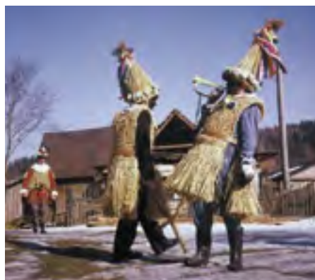
Slaměné maškary se zdobenými homolovitými klobouky a nalíčenou tváří, Chrudimsko, 1983