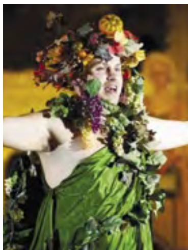
Pořadatelé Carnevale Praha připomínají atmosféru karnevalu, historických slavností a maskarních bálů, kde nechyběla tradiční postava Bakcha