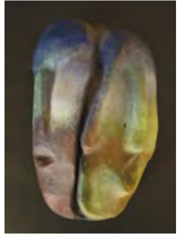
Alter ego, práce autorky, kaširovaná maska, tempera, vosková patina, rozměry 30 × 18 cm, 2002

Knih Maska v proměnách času a kultur je rozdělena do tří celků, první se věnuje charakterizaci masek, vztahům mezi maskou, jejím nositelem a divákem a zabývá se také různými funkcemi a použitím masek. Druhá část je věnována maskám z pěti kontinentů, v jednotlivých kapitolách jsou stručně charakterizované masky z různých kulturních regionů. Je zapotřebí si uvědomit, že přestože se v současnosti s maskami setkáváme spíše v muzeích a galeriích, tvořily a mnohde dosud tvoří součást živé kultury. Třetí část je věnována materiálům a výrobním postupům při tvorbě masky. Rozsah knihy neumožnil zpracovat všechna témata, která se tohoto fascinujícího multikulturního fenoménu týkají. Pokud kniha vyvolá u čtenářů hlubší zájem o masky, případně je bude inspirovat k výtvarné tvorbě, aktivní účasti na masopustu nebo jiné maskované události, budu mít pocit, že moje práce splnila zamýšlený účel.