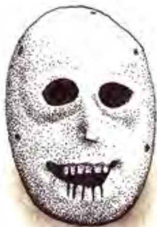
K nejstarším nálezům patří neolitická vápencová maska nalezená v Hebronu