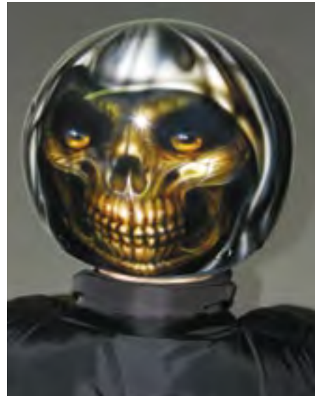
Ochranná motocyklistická helma s malbou lebky na zadní straně vytváří „metamasku“. Autorka Simona Janíčková