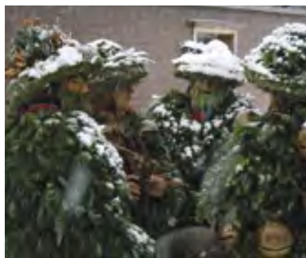
Ve švýcarském městečku Urnäsch se každoročně pořádají prosperitní maskované občůzky