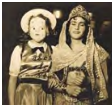
Rodiče autorky na maškarním bále, 1942