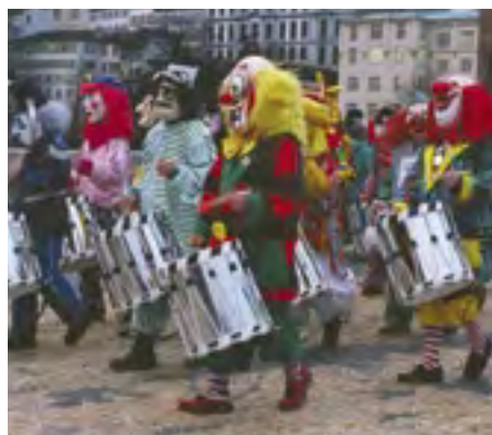
Karnevalový průvod v Bazileji, 2002

Masky nás mohou stále fascinovat nejen jako doklad dávných magicko-kulturních významů, ale také jako etnicko-náboženské a výtvarně-dramatické objekty. Přestože v mnoha případech masky ztratily své původní významy, mnohdy i uměleckou kvalitu, stále nabízí intenzivní zážitky spojené s proměnou vzhledu, nespočtem rolí a identit.