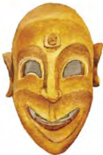
Pohřební maska z pálené hlíny, západní Středomoří, Féniciané (asi 1200 – 800 př. n. l.)