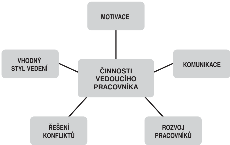
Schéma 2 Role vedoucího pracovníka jako lídra