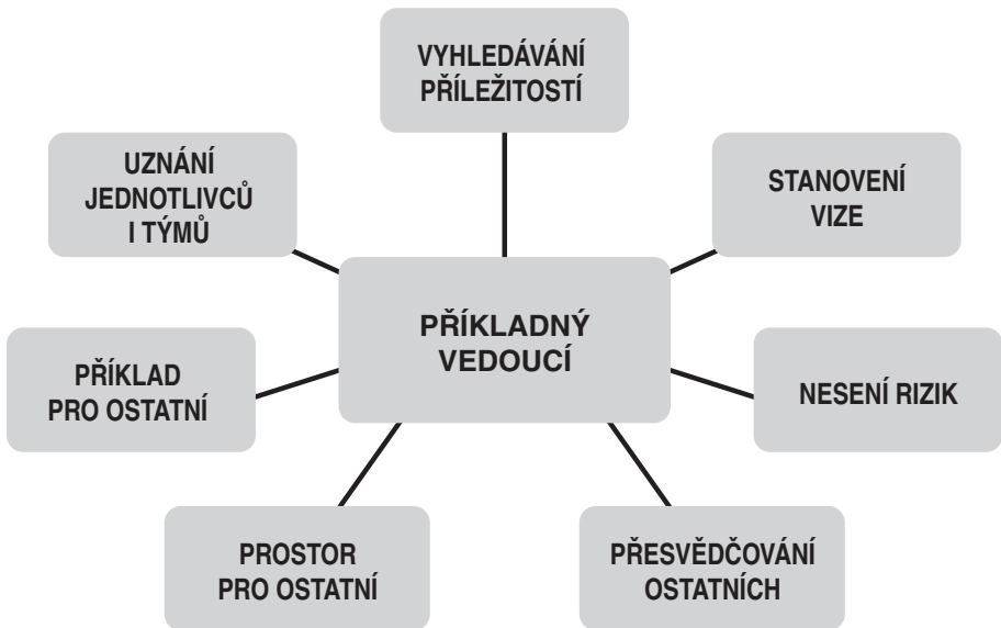
Schéma 3 Charakteristiky příkladných vedoucích