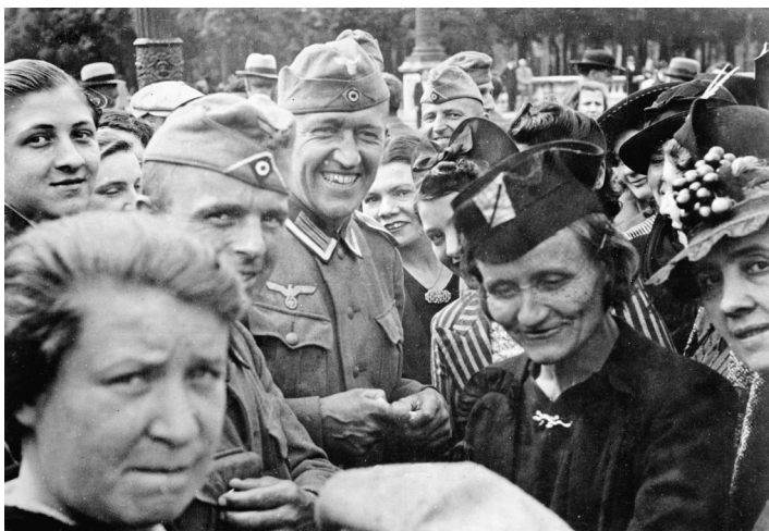
Německé jednotky a francouzští civilisté, 1940

VELKÉ HOTELY SAMOZŘEJMĚ VŽDYCKY BYLY SPOLEČENSKÝMI IKONAMI A DOKONALÝMI ZRCADLY KONKRÉTNÍCH SPOLEČNOSTÍ, JIMŽ SLOUŽILY.