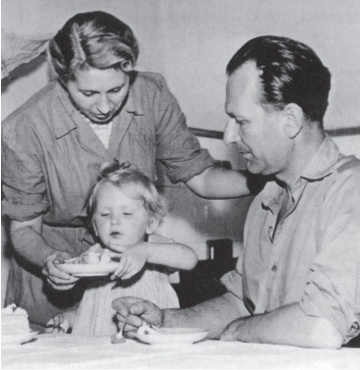
S tátou a mámou u nás doma v kuchyni