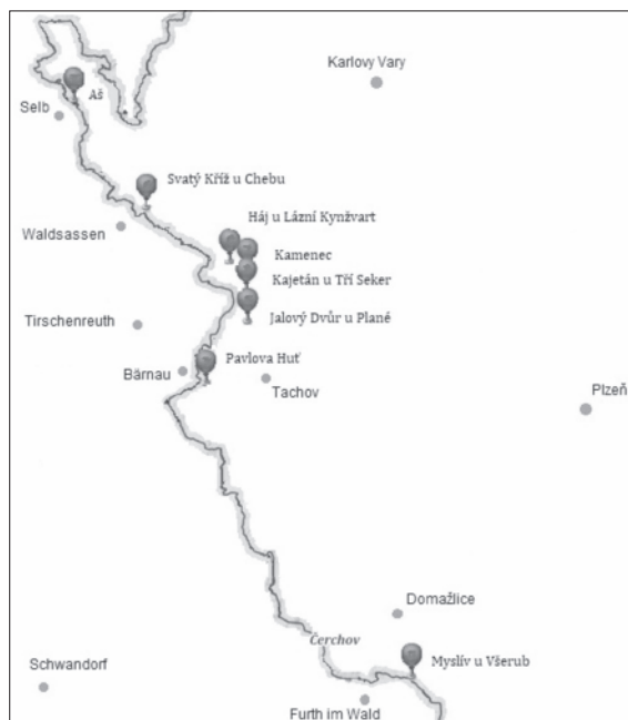
Přehled všech v této knize zdokumentovaných lokalit využívaných na československo-bavorské hranici v letech 1948–1951 k nezákonným provokačním akcím „Kámen“.

i StB v Plzni. Jenže akce „Kámen“ zdaleka nebyla novinkou. Tato metoda byla využívána sovětskými zvláštními službami už před druhou světovou válkou, tudíž je nakonec irelevantní, že vysocí důstojníci StB z Prahy, stejně jako dodnes mnozí historikové a další badatelé, se léta přeli, kdo byl vlastně otcem této ďábelské myšlenky. Pravda, bylo zapotřebí ji přizpůsobit tuzemským podmínkám, ale k tomu mohlo docházet i na radu bývalých partyzánů a komisařů školených kdysi v Sovětském svazu.