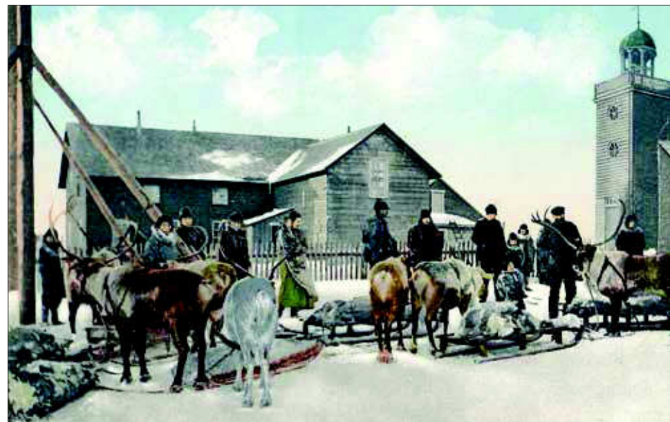
I Misijní stanice Bethel, kde se věnovali chovu sobů

Během let vznikaly i další stanice. Některé neměly dlouhého trvání, ale některé fungují dodnes.