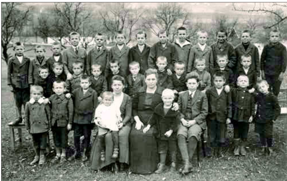
| Chlapecký sirotčinec v Čermné

1898 2. prosince byl v Dubé také otevřen sirotčinec pro první čtyři děvčata. Zakoupenou budovu bylo však nutné zrekonstruovat. V roce 1904 byly úpravy natolik hotové, že sirotčinec mohl pojmout již čtrnáct děvčat.