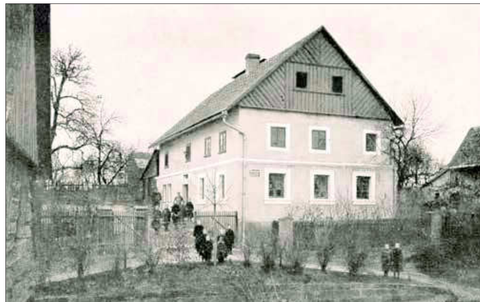
| Budova dívčího sirotčince v Dubé