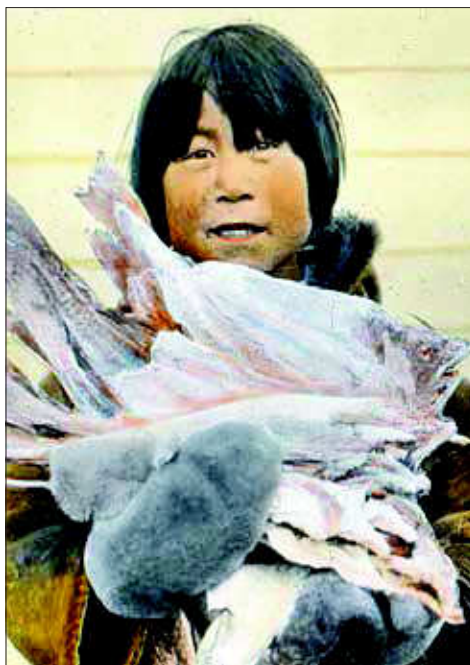
I Především ryby živí aljašské Eskymáky