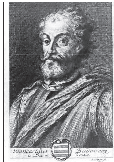
! Václav Budovec z Budova – představitel bratrské šlechty

1631 1. února začala protireformace v Čechách.